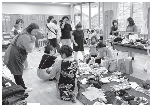
女性部子ども服おゆずり会の様子

(回収店舗) ゆがの薬局、ハートフルコスメゆがの、ホドホドBase、和工房おらんく、山城屋山葵店、徳実屋、太平洋、伊豆ばら園