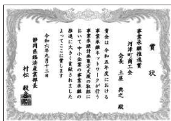
事業承継推進賞の賞状

親族内承継を始め、第3者承継など、地域の事業所が末永く営業するための支援であり、定例相談会は商工会で月1回開催されています。ご相談をご希望の方は商工会までお問合せ下さい。