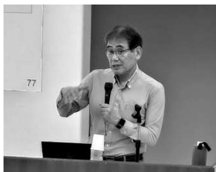
講師：北川中小企業診断士

商工会では、今後BCPに関する個別相談会も計画しており、会員を中心とした事業者の事業継続へのリスクについて、引き続き伴走支援をしていきます。