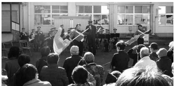
静岡県警察音楽隊記念コンサート