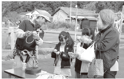
ロープワーク体験