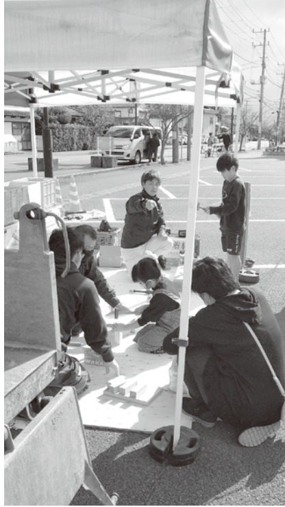
建設資材を使った組み立て体験