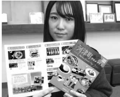
完成した河津町グルメマップ

第1弾・2弾を合わせて500世帯、約73万円分の割引クーポン券の利用がありました。町民の皆様、町内飲食店のご利用どうもありがとうございました。