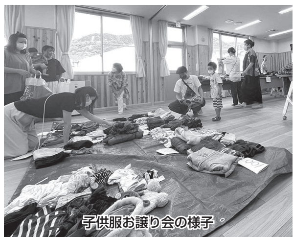
子供服お譲り会の様子

そして、日頃からSDGsをテーマにした活動を中心に行う女性部ですが、中でも子育て世代の支援を重要視した企画として、10月1日(日)に「子供服お譲り会」をかわづこひろばにて開催しました。事前に女性部員の店で秋冬服やおもちゃを回収し、質の良い状態のものが多く集まりました。朝から乳幼児連れの親子など多くの方が来場し、「継続的に定期開催してほしい」、「常設的な場所もあると嬉しい」と大好評でした。子供にはお菓子、大人には部員の手作りハーブ入り石鹸をプレゼントし、喜ばれました。 11月29日(水)には、「天然シルクのセリシン美容液作り講習会」を予定しています。一般の方も募集していますので、お誘い合わせの上、ご応募ください。