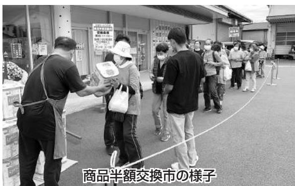
商品半額交換市の様子

今回の開催は12月10日（日）10周年記念開催となる。豪華景品が当たる抽選会や静岡県警察音楽隊の演奏を予定している。