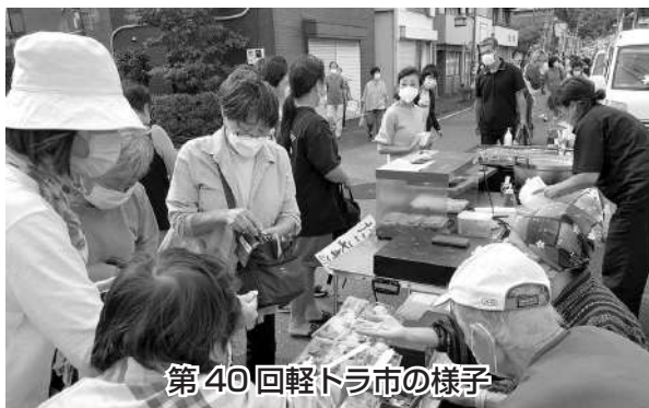
第40回軽トラ市の様子

展示2社を含む31台が出店し、農産物や、お弁当、日曜雑貨、衣料品などの店がならんだ。ハンバーガー、フルーツサンド、占いなどの新規出店も3台あった。3月、6月開催の軽トラ市は雨天により来場者は少なかったが、今回は晴天に恵まれ9時の開始から多くの人出があった。